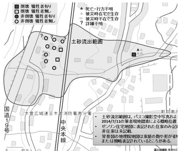
図2 南木曾町読書地区の犠牲者発生状況